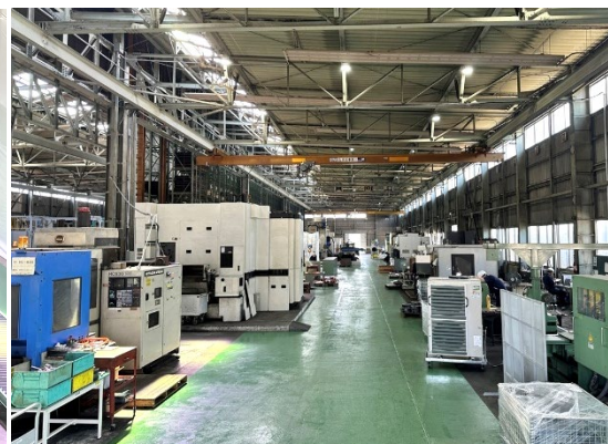
【新鑄造工場 加工機械設備】