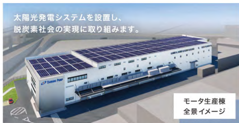
モータ生産棟 全景イメージ