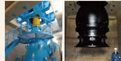
▲ 長野県の排水機場に納入したツルミ最大口径の立軸斜流ポンプ(吐出し口径1800mm、出力420kW)