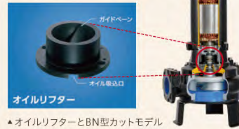
▲ オイルリフターとBN型カットモデル