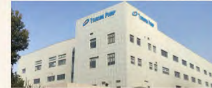
▲ 新上海工場竣工、真空ポンプを生産する上海真空工程(1階)と水中ポンプを生産する上海工場(2階)が統合