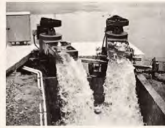
▲農業用水を用水路に汲み揚げるパーチャルポンプTDL型