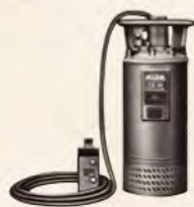
▲製品化された最初の『水中ポンプ』EP型