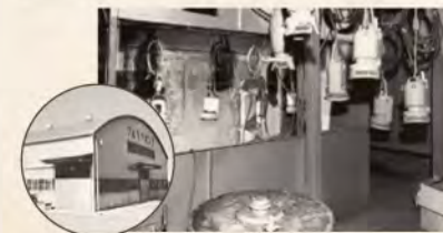
▲小型水中ポンプ専用工場の自動塗装/乾燥機