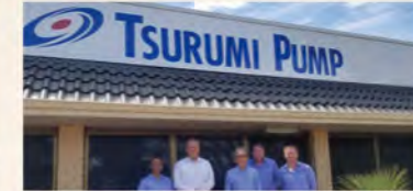
▲ オーストラリア販売現地法人設立、 鉱山市場への販売を強化