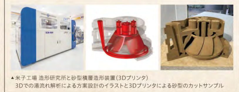
▲ 米子工場 造形研究所と砂型積層造形装置(3Dプリンタ) 3Dでの湯流れ解析による方案設計のイラストと3Dプリンタによる砂型のカットサンプル