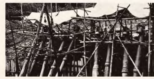
▲現場で活躍するパーチャルポンプTDW型2段式タイプ