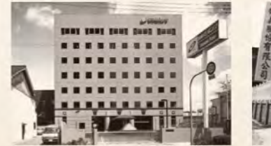
▲大阪本店社屋竣工