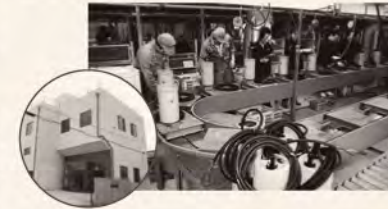
▲ツルミ製品センターの小型水中ポンプライン