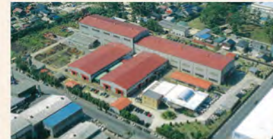
▲ 栗村製作所全景(現米子工場)