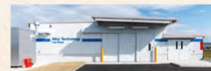
▲ アロイテクノロジー鑄造事業部(八尾工場)竣工、 ツルミグループ初の鑄造事業を開始 3Dプリンタによる砂型からの鑄造で、より高精度な 部品製造が可能