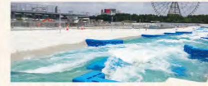
▲ 人口カヌー・スラロームコースの水流作りに貢献した国内最大級の水中ポンプSSP-1350GS型(吐出し口径1350mm、出力350kW)