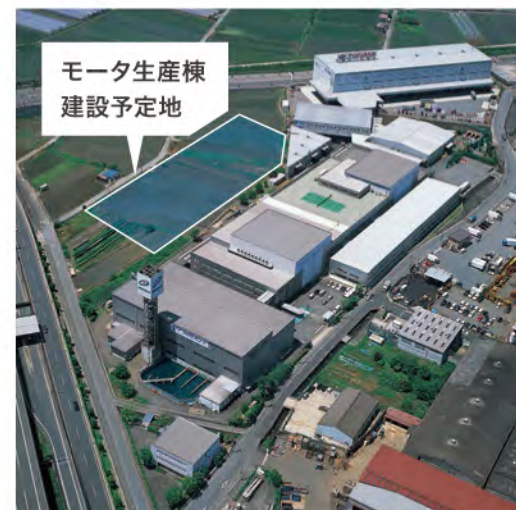
モータ生産棟 建設予定地