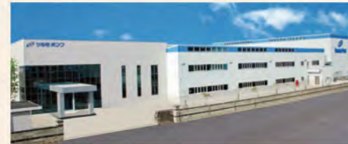
▲ 新台湾工場竣工、主に小型水中ポンプを生産