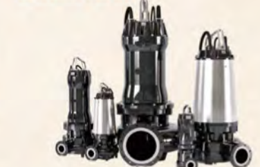
▲ TSURUMI AVANTブランドの水中ポンプ