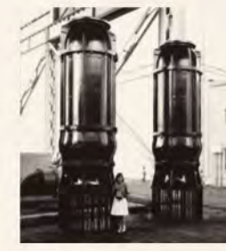
▲長野県の排水機場に納入したTDS-1000MXS型2台