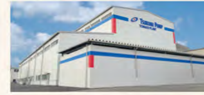
▲ 米子工場 新大型ポンプ生産棟竣工、 水深11m 保有水量3,500m³の大型試験水槽