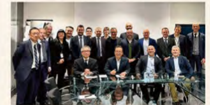
▲ イタリアのZENIT社へ出資