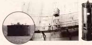
▲明石海峡大橋のケーソンに据え付け作業中の水中ポンプとケーソン沈設に活躍した耐海水用水中ポンプKRS-1437型