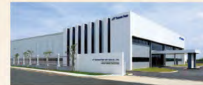
▲ ベトナム工場竣工