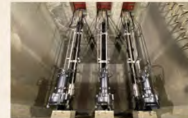
▲ 雨水排水機場に設置され洪水対策用に貢献する高効率水中ノンクログポンプB型