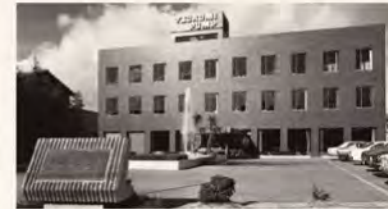
▲大阪本店ビル(3階建て)