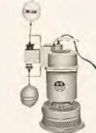
▲設備用水中オートポンプ(フロート式)TB型